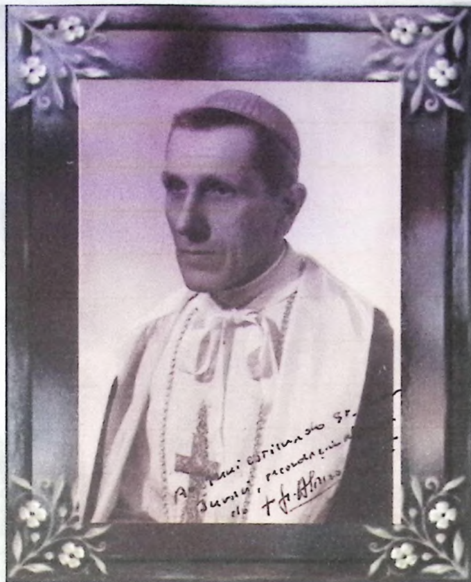
Dom Alano - Bispo de Porto Nacional por 40 anos

Ao confessar-se com Dom Alano, recebe uma graça como uma semente na sua alma. No pouso seguinte, dia 10 de agosto na Lagoa de Enéas, ao celebrar a missa, Dom Alano lembra-se deste menino e reza por ele.