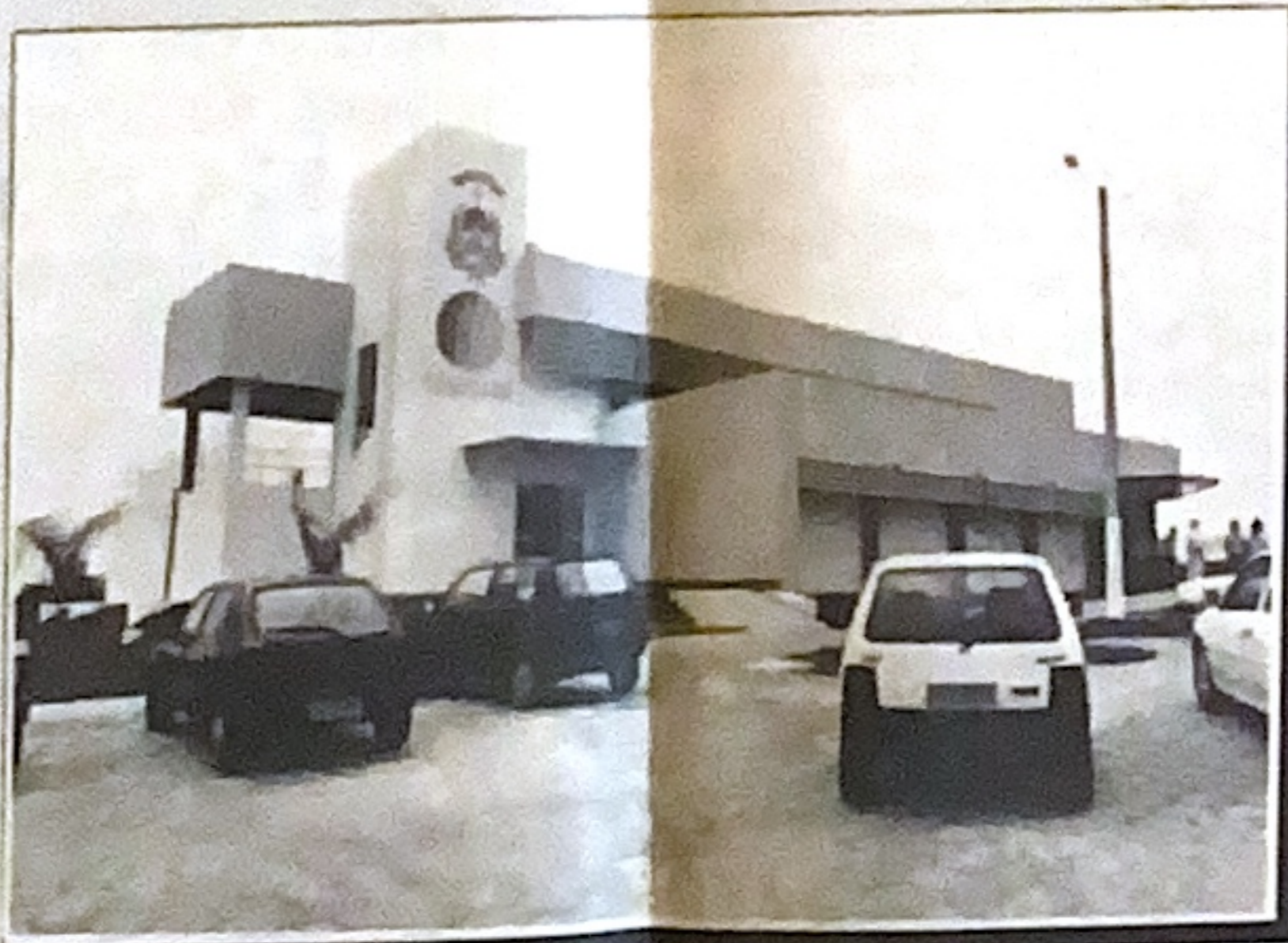
Somente no sistema de água tratada foram gastos mais de R$ 6 milhões de Reais

Campos realmente investiu na área de Educação em Porto Nacional? A população vai saber. O número de escolas reformadas, as melhorias e ampliações dos ginásios e outros benefícios nesta área.